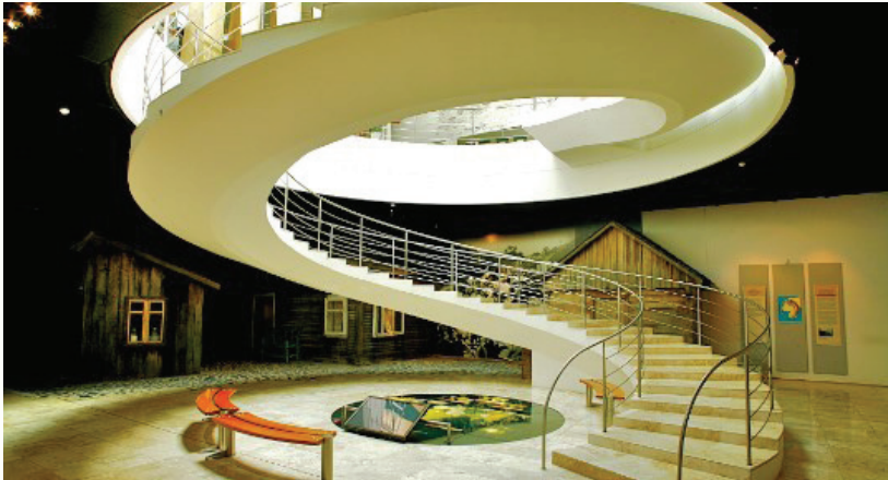
Inside of the Jewish Museum