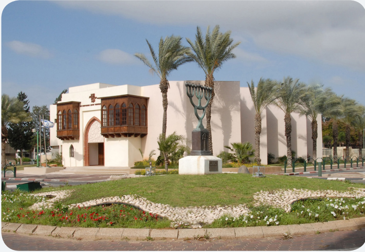
המרכז למורשת יהדות בבל, אור יהודה Babylonian Jewry Heritage Center in Or-Yehuda